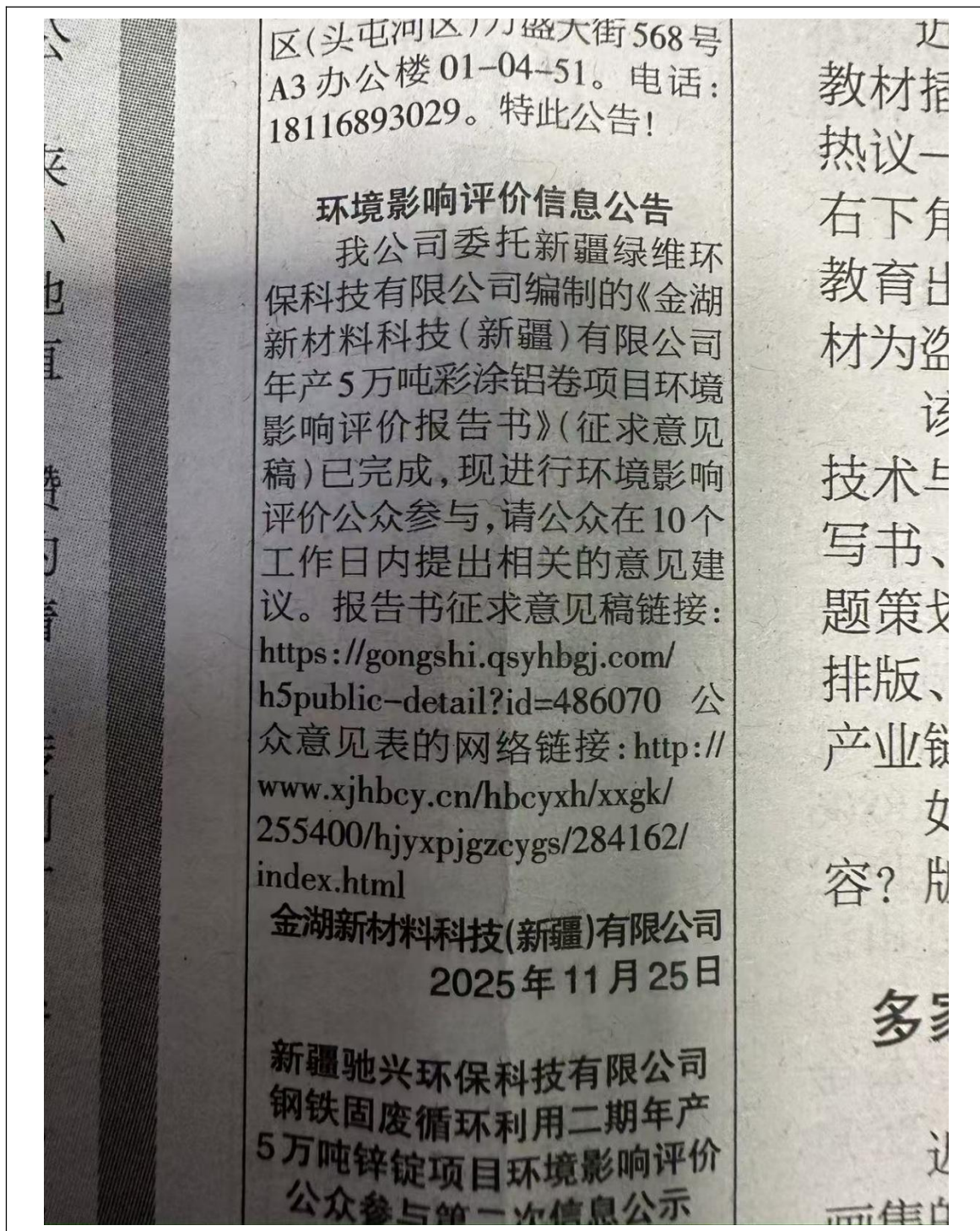
图 3 本项目第一次报纸公示照片

金湖新材料科技（新疆）有限公司分别于 2025 年 11 月 25 日及 2025 年 11 月 26 日，在新疆法制报对项目的环评信息进行了两次公告。载体选择符合《环境影响评价公众参与办法》要求。征求意见稿两次报纸公示截图见图 3 及图 4。