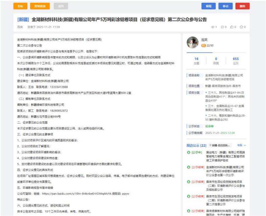
图 2 本项目征求意见稿网络公示证明