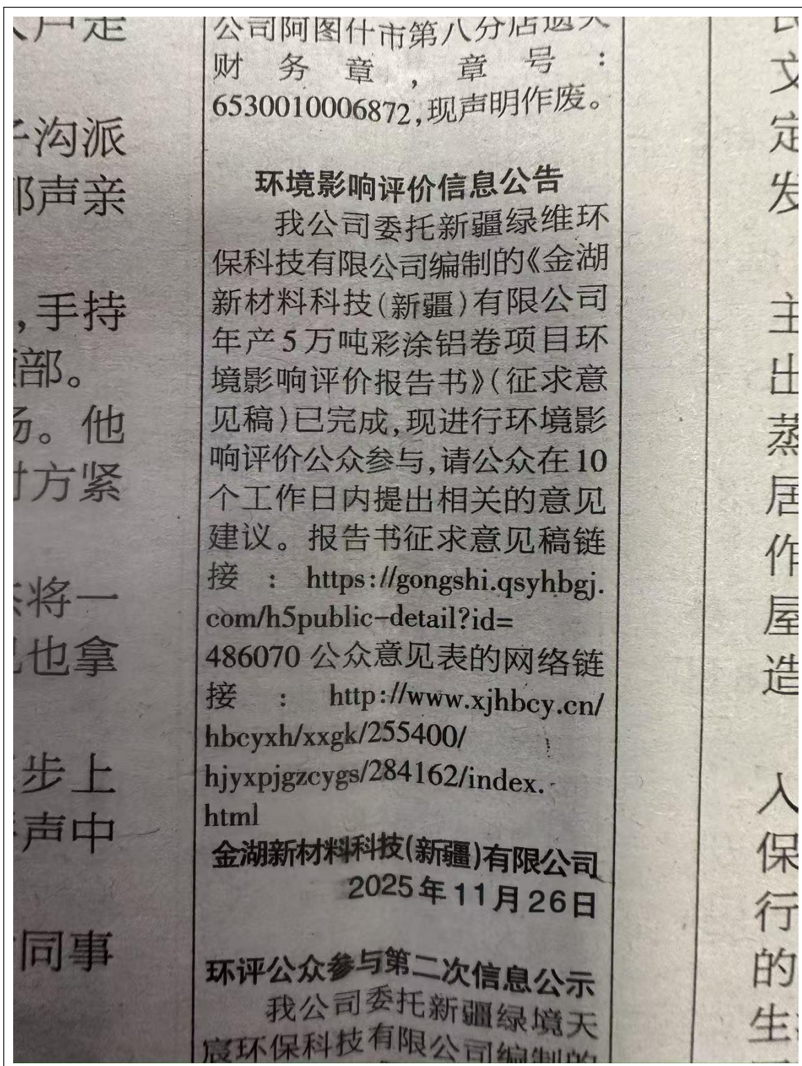
图4 本项目第二次报纸公示照片