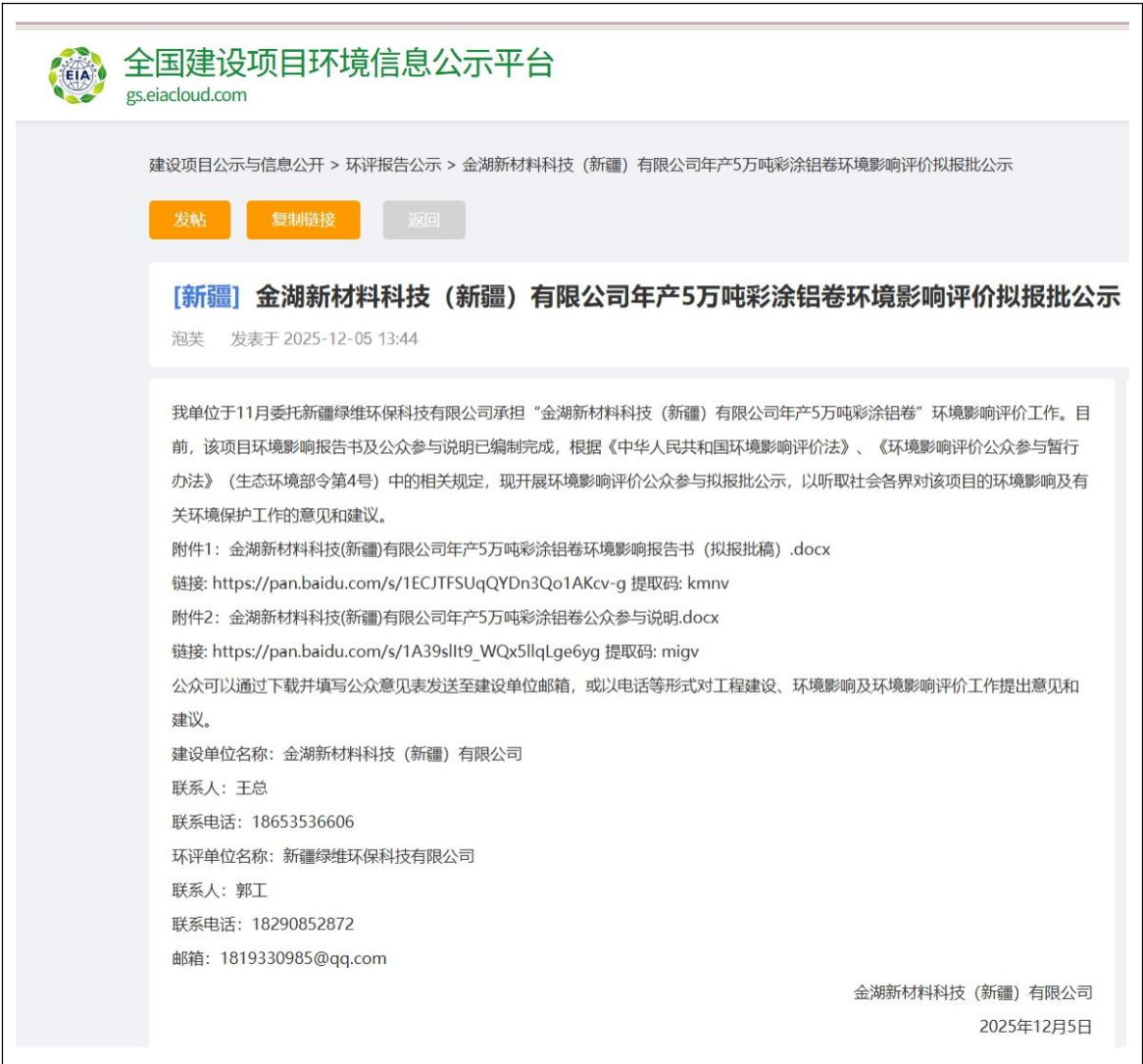
图 7 本项目拟报批前网络公示截图