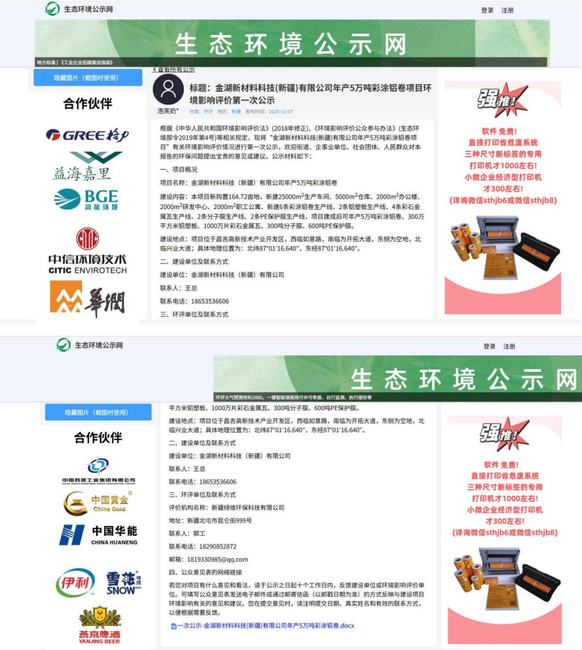
图 1 本项目第一次网络公示证明