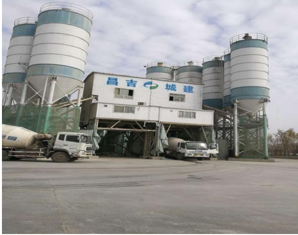
厂区混凝土搅拌站