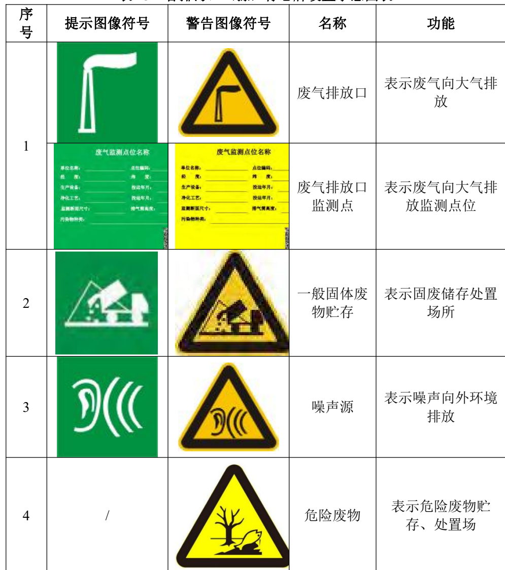
表 43 各排污口（源）标志牌设置示意图表

要求各排污口（源）、固废贮存场提示标志形状采用正方形边框，背景颜色采用绿色，图形颜色采用白色，警告标志采用三角形边框，背景颜色采用黄色，图形颜色采用黑色，标志牌应设在与功能相应的醒目处，并保持清晰、完整。